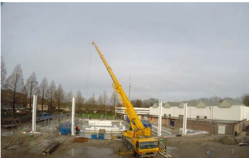
Op de bouwplaats wordt hard gewerkt, de staalconstructie wordt gemonteerd